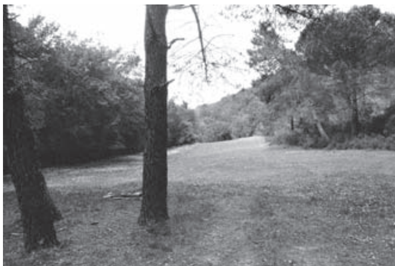
Els prats de can Gironès, a tocar del riu Daró.

«...ENS ENDINSEM EN LA CASTANYEDA D'EN GIRONÈS. PERXES DE CASTANYER, PRIMES, RECTES I ALTES, ENS ACOMPANYEN EN AQUEST TRAM, FRESCAL I HUMIT BONA PART DE L'ANY.»