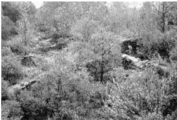
La vegetació ha envaït les ruïnes d'habitacles del poble de Cidillà.

forats dels murs amb rajol i es va fer una porta nova. El 1984 les obres es varen interrompre per raons que ignoro, i aviat la porta i les tapiades de rajol varen