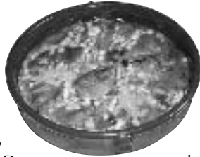
Cassola de peus de porc amb mongetes del ganxet. A sota: les postres, botifarres dolces amb pomes.