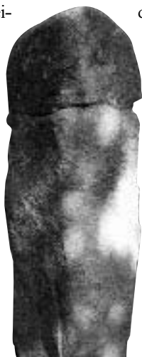
A dalt: església de Romanyà de la Selva. A sota: el menhir de la Murtra, prop de Romanyà.

Anem baixant suaument i a uns 500 metres de la casa, a mà esquerra, un xic emboscada, però de fàcil accés, hi ha la resclosa i la bassa de can Salvador, que sens dubte mereix una aturada. Uns metres més avall, arribem a una cruïlla. Hem d'anar cap a l'esquerra. Sobre un petit promontori, hi ha un terme divisor de municipis. Al cap de pocs metres, a mà dreta, es pot veure el que queda del colossal pi de can Salvador. Més endavant ens retrobem amb la carretera asfaltada. L'hem de seguir cap a la dreta i al cap de ben poca estona arribarem al lloc de la sortida de la ruta 🚶