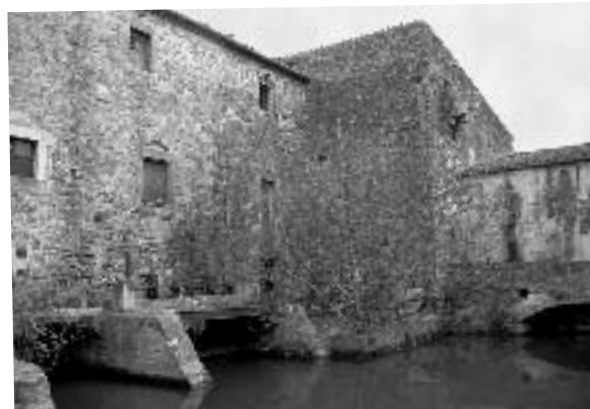
A dalt, la barraca i el rec del Molí. A l'esquerra, el molí de Gualta.

Final a les basses d'en Coll. Anem seguint les marques grogues i blanques del PR-C108 paral·leles al rec d'en Coll. Creuem el pont de la barraca d'en Quaranta i continuem avall pel marge dret del rec fins a arribar dins l'espai natural protegit de les basses d'en Coll, un dels últims vestigis d'aiguamolls i llacunes de la zona del Baix Empordà. En aquest punt, es troben totes les aigües dels recs i sèquies de la zona i val la pena perdre's per aquests entorns per tal d'observar els ànecs collverds, les polles d'aigua o fins i tot algun agró roig. La ruta acaba al punt d'informació de l'espai natural, on podrem obtenir informació més detallada d'aquest espai natural 📍