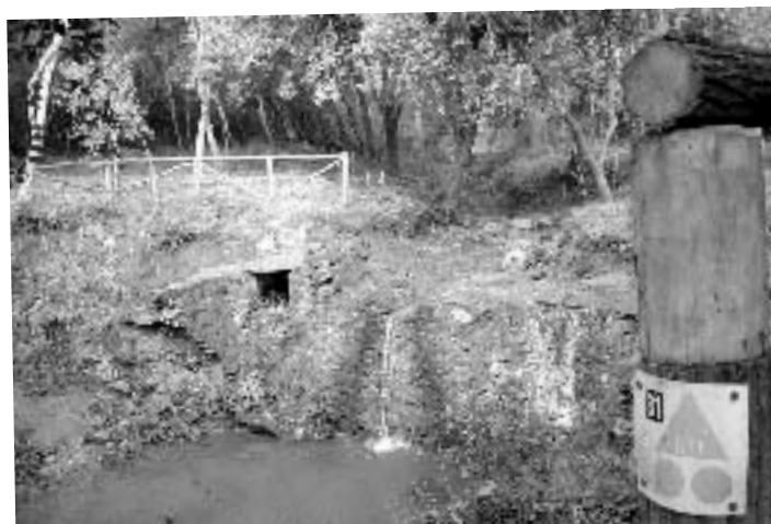
La resclosa del molí del mas Antoniet, a tocar el nostre itinerari.

mita de Bell-lloc, generalment tancada però que podem visitar durant l'aplec, que té lloc el setembre. La trobada popular és el Vot de la vila de Pala-